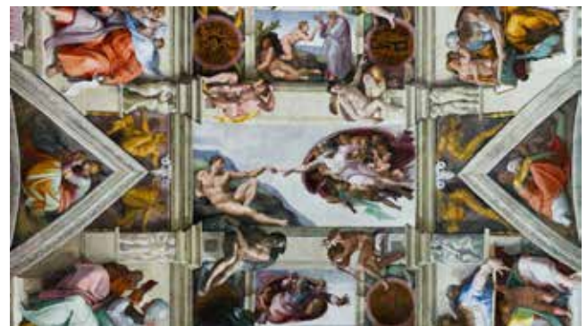
Collège des Bernardins (France – Île-de-France) : Joseph Haydn : La création