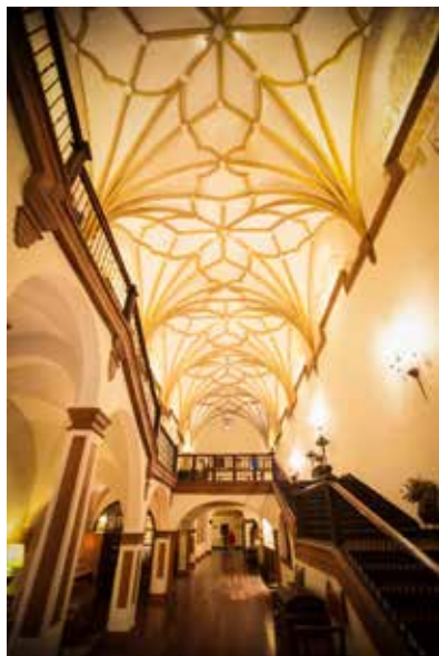
Rioseco (Spain – Castilla y León) : Colocación de la cubierta de la sala capitular del monasterio de rioseco

l'hôtel-monument et du spa avec l'intention d'améliorer le degré de confort et la satisfaction de nos clients. Les oeuvres de réfection et de maintenance qui ont été réalisées dans l'immeuble correspondent à la réfection complète de la façade sud de l'hôtel et au pavement de la Place d'accès à l'hôtel. De la même manière, on a réalisé la réfection du bar-salon Gaufrido. Ces améliorations ont supposé un investissement dépassant les 700.000 €. Le Monasterio de Piedra a un souci constant de l'amélioration de son hôtel-monument et spa en présentant à ses clients un meilleur service et une plus grande qualité. De plus, au cours de cette nouvelle saison, on a mis en place des expériences faites et pensées à la mesure de la clientèle de notre hôtel : Des offres spéciales pour les plus de 55 ans, pour les jeunes gens, des programmes de traitement et de massages dans le spa, des avantages pour célébrer les mariages et pour le tourisme d'affaires... et la prochaine nouvelle lettre et les menus dans le restaurant Reyes de Aragón. Foto escalinata hotel en email. Bóveda del s. XVI