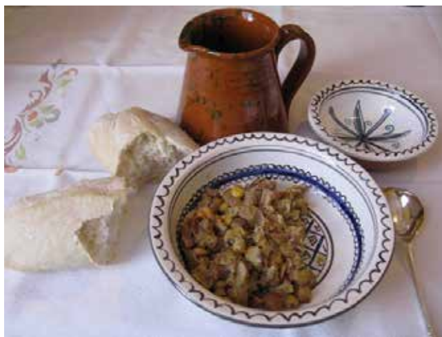
Piedra (Espagne – Aragon) : expérience œnotourisme dans L'Hôtel Monasterio de Piedra

della mostra dello scorso anno dedicata all'accoglienza dei monaci cistercensi verso i poveri e i pellegrini, ha intrapreso anche uno studio, attraverso pubblicazioni di settore, sulla cucina monastica, riuscendo a ricavare una lunga lista di generi alimentari, provenienti sia dalla produzione locale sia dall'attività commerciale come l'olio, il sale, il pepe, le spezie e i datteri. Si è rinvenuto addirittura un menù della seconda metà del XII secolo con quattro pietanze. Da qui è nata l'idea di proporre al pubblico la degustazione di alcuni di questi "Cibi dei pellegrini". Domenica 6 aprile alle ore 15 l'appuntamento sarà con "Dolci e frittelle di grasso e di magro"; giovedì 1° maggio "Dolci e frittelle per ogni gusto"; 11 maggio "Pasto dei pellegrini", pranzo medievale in sala capitolare; 17 e 18 maggio "Taverna medievale" in occasione della manifestazione storica "Trecentesca"; 7 settembre degustazione di cibi per i pellegrini; 5 ottobre "Dolci per ogni festa"; 26 ottobre "Zuppa d'autunno" e 9 novembre, festa di Sant'Uberto patrono dei cacciatori, "Cinghiale". Per approfondimenti si rimanda al sito dell'abbazia: www.abbaziamorimondo.it