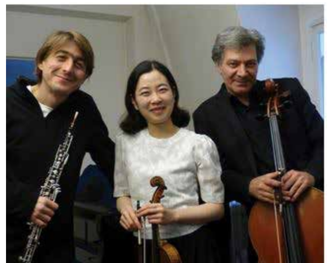
Photo Trio Hautbois

La Prée (France – Centre) : concert du sixantième anniversaire