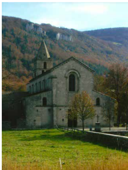
Léoncel (France – Rhône-Alpes) : Amis de Léoncel : programme pour 2014