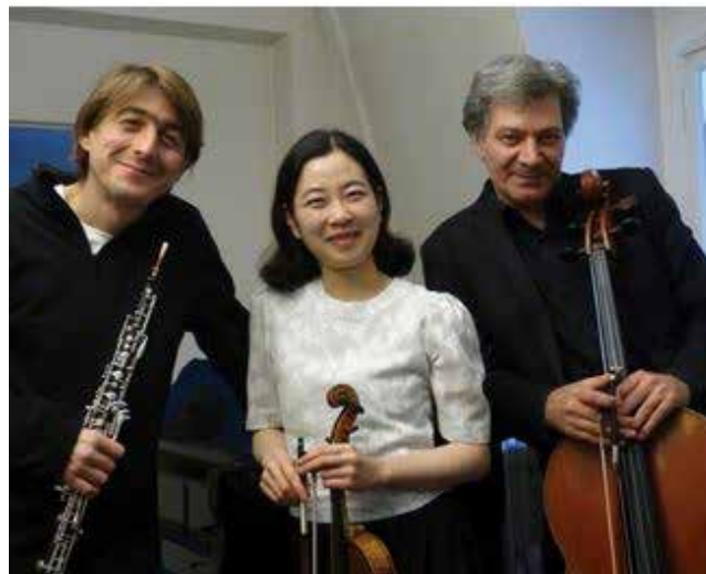
Photo Trio Hautbois

La Prée (France – Centre) : concert du soixantième anniversaire