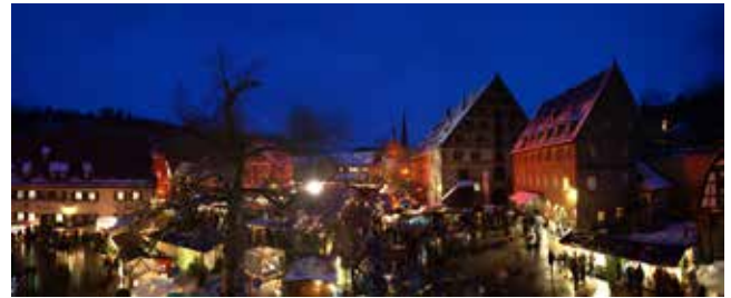
Maulbronn (Deutschland – Baden-Württemberg) : Festlicher Weihnachtsmarkt im Klosterhof

Am 7. und 8. Dezember 2013 duftet es wieder nach Glühwein und Plätzchen. Die 120 festlich geschmückten Stände bieten in der besinnlichen Atmosphäre des Klosterhofes hochwertiges Kunsthandwerk, weihnachtliche Floristik und Imkereiprodukte an. Regionales und typisches Speiseangebot, ob Glühwein, Bratwurst, Schupfnudeln, Flammhachs, Reibekuchen, Wildgulasch oder Maulbronner Klosterpunsch locken die Feinschmecker. Am 7. Dezember findet ein Konzert der Kurrende und am 8. Dezember eine Andacht mit Posaunenchor statt. An beiden Tagen können Kinder nicht nur Laternen basteln, sondern auch weihnachtliche Geschichten und Märchen hören. Am Sonntag ist der Nikolaus mit Geschenken für die Kinder auf dem Markt zu Gast. Außerdem bietet das Klosterteam Führungen im Kloster an – die sollte man nicht versäumen. Weitere Informationen unter info@kloster-maulbronn.de oder www.kloster-maulbronn.de