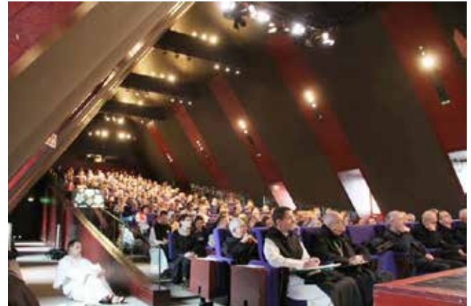
Noirlac (France – Centre) : matinale du dimanche 27 octobre

en œuvre des célébrations liturgiques dans leurs diocèses à participer à cette manifestation. Conçu intentionnellement dans une grande ouverture aux diverses sensibilités liturgiques ce colloque a réuni les 11 et 12 septembre derniers près de 250 participants.