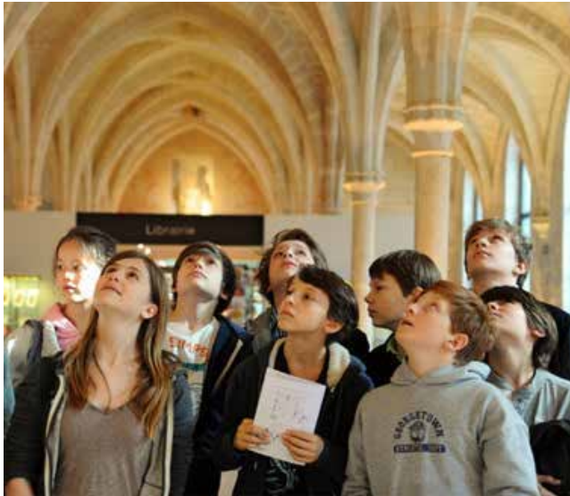
La Prée, Noirlac, Fontmorigny (France – Centre) : marché monastique dans les abbayes du Berry

l'aide de nombreux indices, les enfants accompagnés de leurs parents mènent l'enquête qui les conduira du Musée d'art et d'histoire du Judaïsme, à l'Institut du Monde Arabe et au Collège des Bernardins. Les dimanches 27 octobre, 17 novembre et 8 décembre http://www.collegedesbernardins.fr/fr/evenements-culture/jeune-public/parcours-enquete-un-manuscrit-a-disparu-1.html