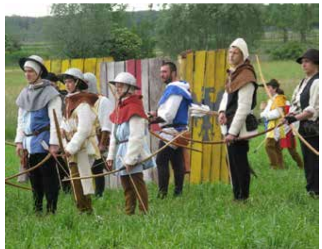
Morimondo (Italia - Lombardia) : Festa di Sant'Uberto, patrono dei cacciatori

Domenica 3 novembre presso l'Abbazia di Morimondo si celebra la Festa di sant'Uberto, patrono dei Cacciatori, evento promosso dall'Assessorato alla Caccia e Pesca della Provincia di Milano, in collaborazione con la