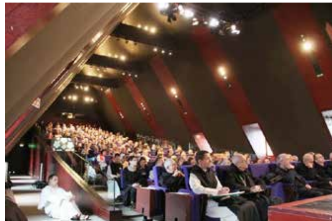
Noirlac (France – Centre) : matinale du dimanche 27 octobre

en œuvre des célébrations liturgiques dans leurs diocèses à participer à cette manifestation. Conçu intentionnellement dans une grande ouverture aux diverses sensibilités liturgiques ce colloque a réuni les 11 et 12 septembre derniers près de 250 participants.