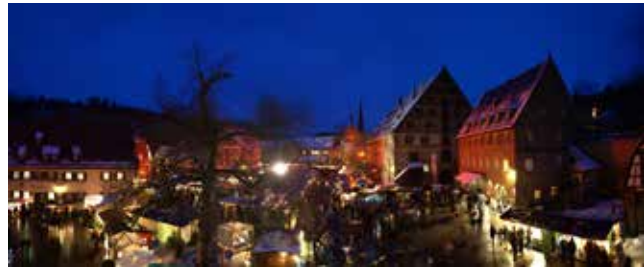
Maulbronn (Deutschland – Baden-Württemberg) : Festlicher Weihnachtsmarkt im Klosterhof

Am 7. und 8. Dezember 2013 duftet es wieder nach Glühwein und Plätzchen. Die 120 festlich geschmückten Stände bieten in der besinnlichen Atmosphäre des Klosterhofes hochwertiges Kunsthandwerk, weihnachtliche Floristik und Imkereiprodukte an. Regionales und typisches Speiseangebot, ob Glühwein, Bratwurst, Schupfnudeln, Flammhachs, Reibekuchen, Wildgulasch oder Maulbronner Klosterpunsch locken die Feinschmecker. Am 7. Dezember findet ein Konzert der Kurrende und am 8. Dezember eine Andacht mit Posaunenchor statt. An beiden Tagen können Kinder nicht nur Laternen basteln, sondern auch weihnachtliche Geschichten und Märchen hören. Am Sonntag ist der Nikolaus mit Geschenken für die Kinder auf dem Markt zu Gast. Außerdem bietet das Klosterteam Führungen im Kloster an – die sollte man nicht versäumen. Weitere Informationen unter info@kloster-maulbronn.de oder www.kloster-maulbronn.de